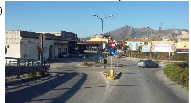
stato di progetto